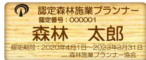
木製ネームプレート (裏面クリップ付き)